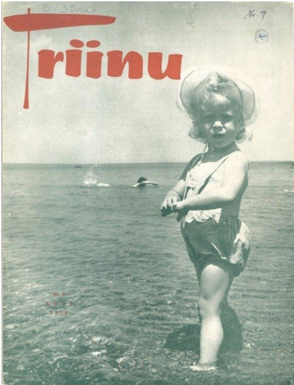
1.5. Ajakirja Triinu esikaas (1955, nr. 9)